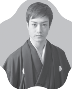
しゅんぷうてい しょうりょう 春風亭 昇羊