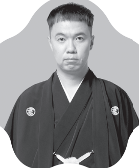
たてかわ きっしょう 立川 吉笑

1995年 三代目三遊亭圓歌入門 前座名「歌きち」 1999年 ニツ目昇進 「歌彦」と改名 2008年 真打昇進 四代目「歌奴」を襲名 2010年 平成21年彩の国落語大賞 受賞