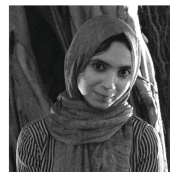
アーティストトーク 特別ゲスト 『The Fourth Wall』監督 Mahboobeh Kalae