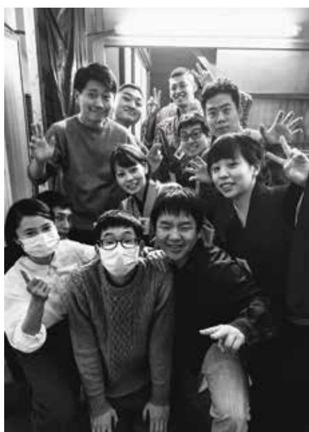
騒動の中寄席で働く未来ある前座さん。「オレたち前座のころ、コロナで大変だったよなあ」と言えるぞ。

て相談した結果、実家に戻ることはやめたという。ちっとも知らなかった。昔から順風満帆だったと思っていたのだから苦勞していたようだ。楽屋仲間に聞いてみると交通費を浮かすために全ての寄席の移動を自転車にした前座は数知れず。二ツ目時代、カミさんと二人三脚自転車操業だった仲間も多い。