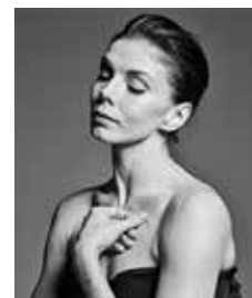
ナタリア・オシポワ Natalia Osipova

最後のシーンは、バレエ『ジゼル』の第2幕の衣装で、人間（バレエでは男性だが）がウィリに困まれ、力尽きるまで踊らされ沼に突き落とされる音楽で踊る。この情景は、スペシフツェワが発病したとき、シドニーの泥の道を一人さ迷い歩いていた事実にも重なるように思う。力が抜けて倒れては立ち上がり急速に旋回することを繰り返す、何かに取り憑かれたようなオシポワの姿からは、バレエ芸術の残酷なほどの厳しさへの非難や反発ではなく、バレエにすべてを捧げつくせずにはいられないバレエダンサーたちの、この芸術の究極の美への渴望、とてつもなく大きな愛が感じられるのである。