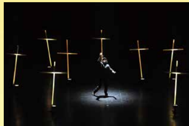
『ストロベリーフィールズ』（2015）Photo © HARU

子守唄ではあるのだが、同時に、裏には濃厚な「解散」や「別れ」の気配が漂う歌だからだ。