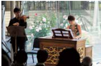
過去の公演の様子