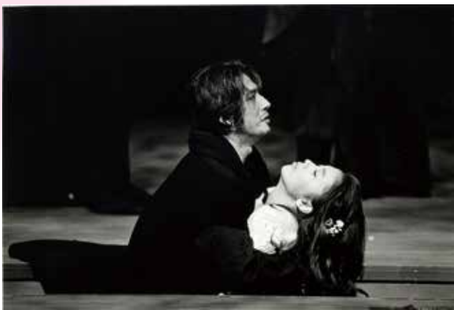
銀座セゾン劇場1995年10・11月公演『ハムレット』 （ハムレット：真田広之、オフィーリア：松たか子）

それでも、というよりだからこそ、あの蛭川さんの言葉を思い出すたびに胸が熱くなる。