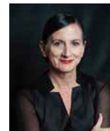
メルル・タンカード Meryl Tankard

ロシア出身のバレエ・ダンサー。ボリショイ・バレエ団、ミハイロフスキー・バレエ団を経て現在英国ロイヤル・バレエ団のプリンシパル・ダンサー（2013～）。圧倒的なテクニックとドラマティックな表現力に定評があり、レパートリーも多数。中でも『ジゼル』のタイトル・ロールは当たり役とされている。近年はコンテンポラリー作品にも積極的に出演。ブノワ賞、英国舞踊批評家協会賞など受賞も多数。