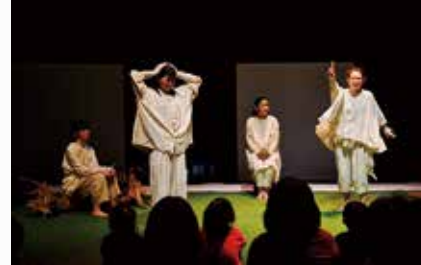
『めにみえない みみにしたい』(2019年再演)

んが最初に「境界線」って言葉を出してくれたけど、建物の中には「かがみ」と「まど」と「とびら」っていう境目が存在してるなってことを最近考えてるんです。その境界線のことを、子どもたちはどう見るのか。生まれたばかりのときは、そこに境目があるんだってことを知らなかったのに、「これは鏡で、そこに映っているのは自分だ」と知ったり、自分と他の人とは違うんだってことを知ったりして、境目に気づいていく。でも、そんな境目なんて最初はなかったってことを、『めにみえない みみにしたい』のツアー中に思ったんです。やっぱり、子どものほうが大人より早く、作品との境目がなくなる。大人は「自分は観客だから」という線を引くけど、子どもは境