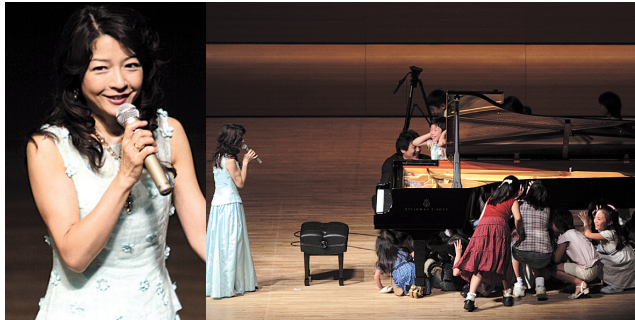
2006年9月 埼玉会館の公演より © 加藤英弘