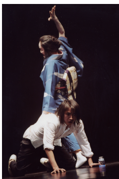
『身毒丸』ファイナル2002年 ©西村洋