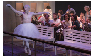
さいたまゴールド・シアター第1回公演 2007年6月